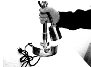
Falsch ! nicht den Leuchtenarm umfassen!